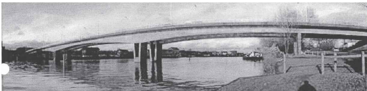
Le pont de la Première Armée française